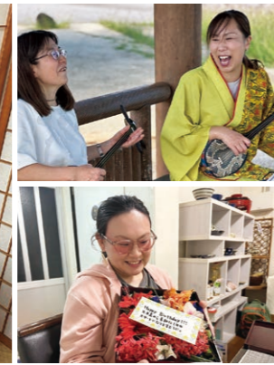
ブクブク茶体験の様子(左)。地元の奏者と一緒、参加者はお母さんの思い出の曲を奏でます(右上)。パースデー当日には、メッセージを添えたお花の贈呈も(右下)。

み合わせのことを考えました。本事業にエントリーしたことで離島の下見や自治体との関係作りがスムーズになり、コンテンツ造成がスピードアップしました。海ごみを集めるだけでなく、離島のごみ問題と向き合うことにも意義があり、地域の方たちとの交流は欠かせません。ツアーの評判は上々で、毎回募集締め切り前に定員に達する盛況ぶり。今後は県外からの集客の仕組みづくりや、法人の継続的な活動に必要な資金造成などの課題がある。 現在の達成島は伊平屋島はじめ久米島、伊是名島など11島。全島制覇への旅は始まったばかりだ。