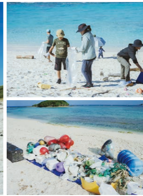
1泊2日の伊平屋島ツアーでは、県内外からの参加者に地元の中生も合流し、島内の2カ所にてビーチクリーンを実施。人気ユーチューバーによる解説や、即席幼児水族館づくりも好評だった。