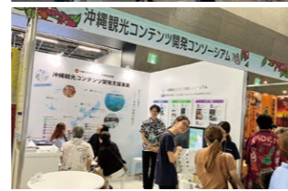
上) FAMツアーの様子 下) ツーリズム EXPOジャパン2026 (愛知) 本事業ブース