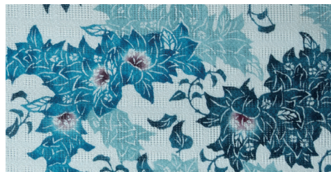
紅型工房ひがしや

那覇市に拠点を置き、古典の技を大切にしつつ現代の感性を取り入れ、紅型を未来へとつなぐ工房です。