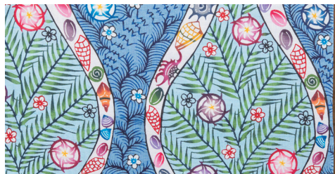
城間びんがた工房

紅型を琉球王朝以来 300 年継承し 16 代目による伝統技術と手仕事を守る沖縄の老舗紅型工房です。